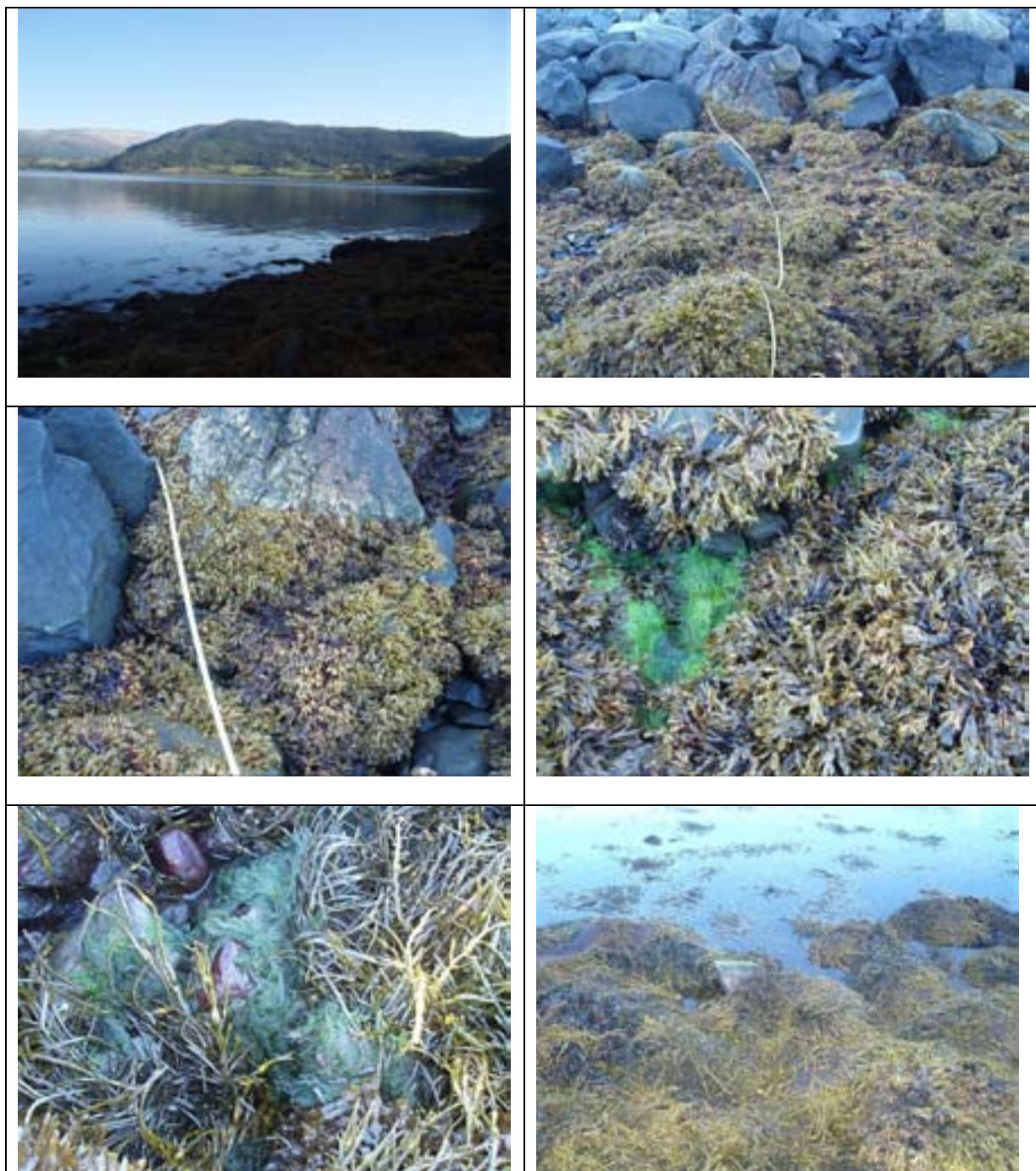
Figur 5. Stasjon VEF3 Aasmulen. Stasjonen ble lagt nedenfor en gammel jernbanefylling. Blæretang og grisetang dominerte i fjæra, med noe fjæreblood og vanlig grønndusk under grisetangen.