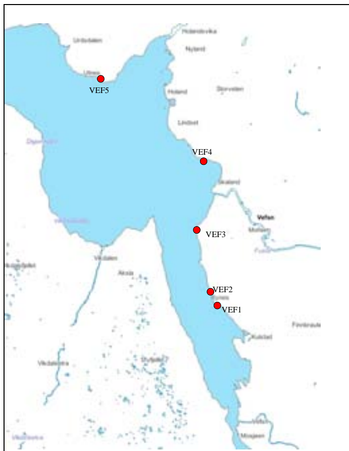
Figur 2. Stasjoner for undersøkelse av alger og dyr i fjæra.