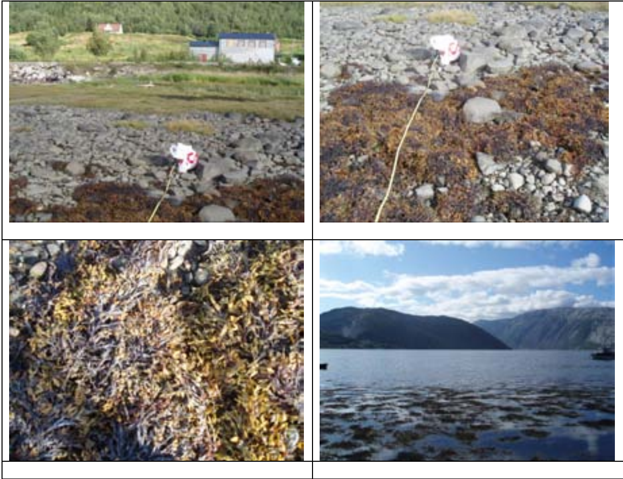
Figur 6. Stasjon VEF4 Søfting. Stasjonen hadde svak helning i fjæra med små og mellomstore stein. Svært artsfattig.