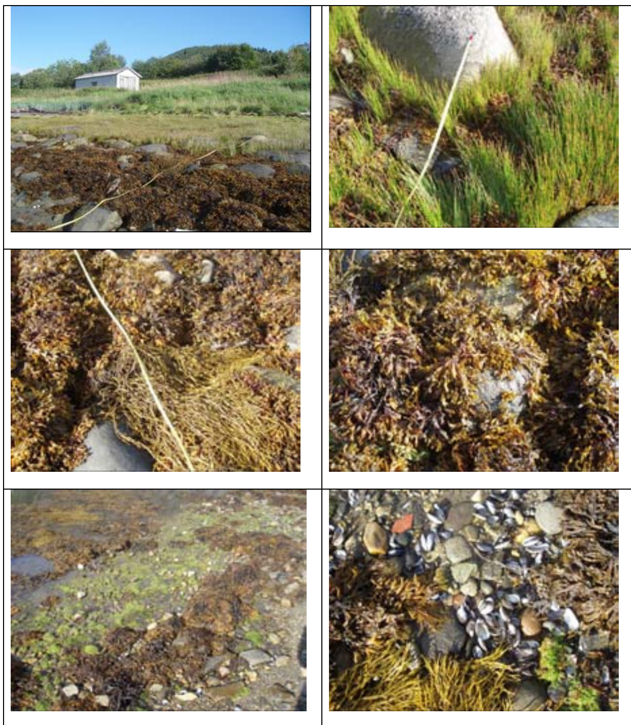
Figur 3. Stasjon VEF1 Rynes sør. Slak hellende fjære med stein og sand. Organismesamfunnet var dominert av blæretang og grisetang. Et belte med tarmgrønnske synlig i grisetangbeltet (bildet nederst til venstre).