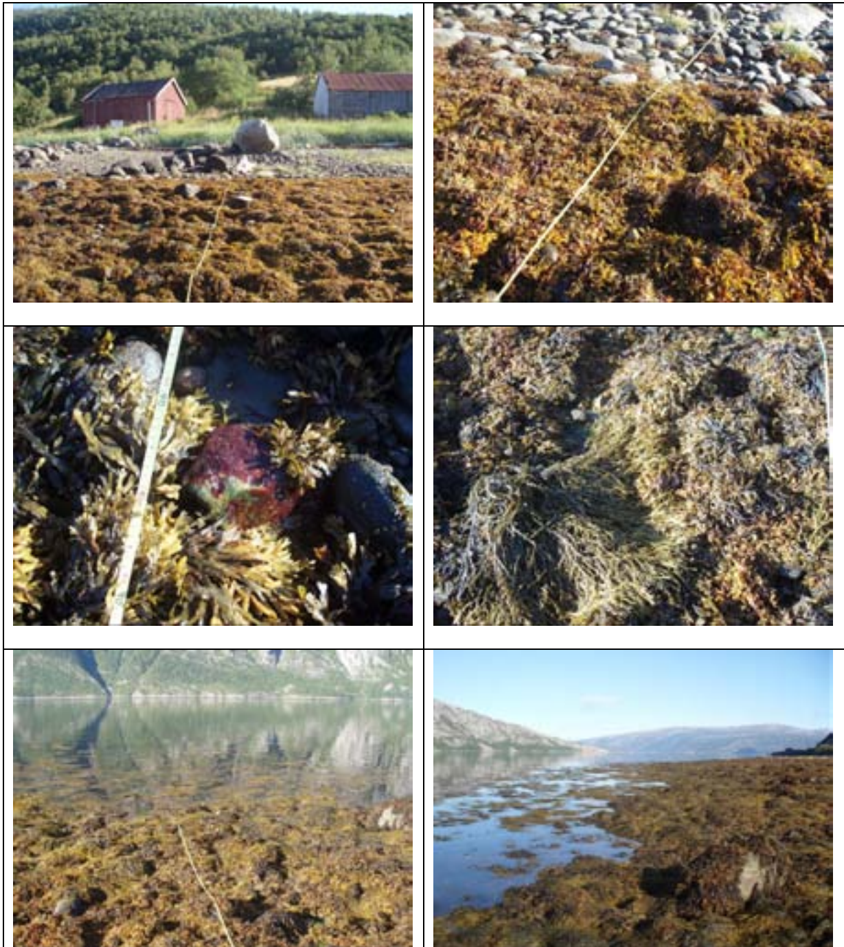
Figur 4. Stasjon VEF2 Rynes nord. Slak hellende fjære med små og mellomstore stein. Organismesamfunnet var dominert av blæretang og grisetang uten påvekstalger.