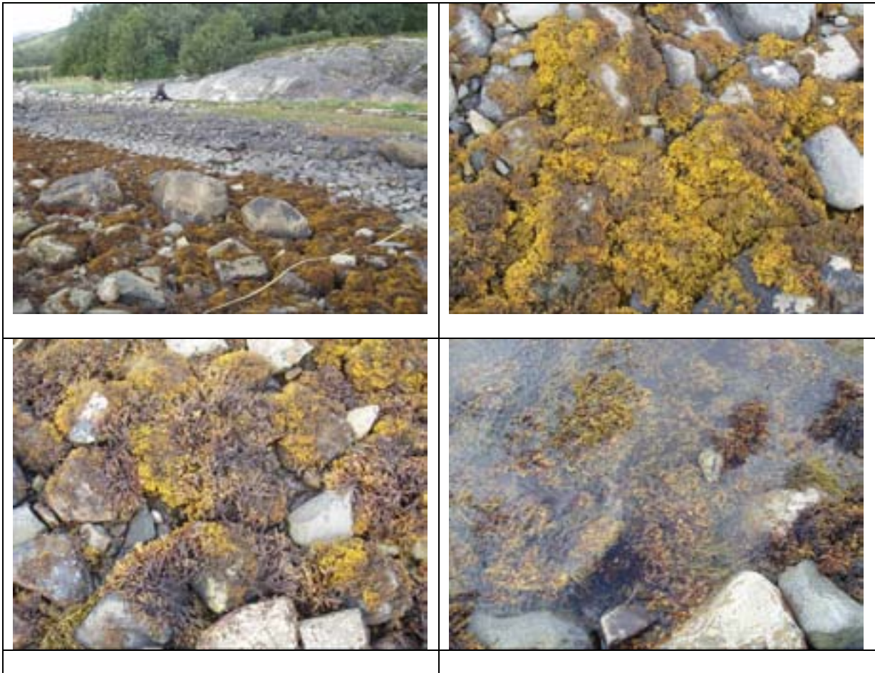
Figur 7. Stasjon VEF5 Utneset. Stasjonen ble lagt til steinfjære med svak helning. Små og mellomstore stein. Tett belte av sauetang i øvre del av fjæra, etterfulgt av brede belter med hhv. blæretang og grisatang.