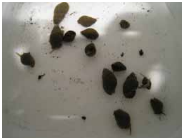
Figur 2. Fotografi av det eksperimentelle oppsettet (a.), Hediste diversicolor sortert ut for tilsetting i akvarium ved forsøksstart (b.) og nettsnegl, Hinia reticulata (c.).