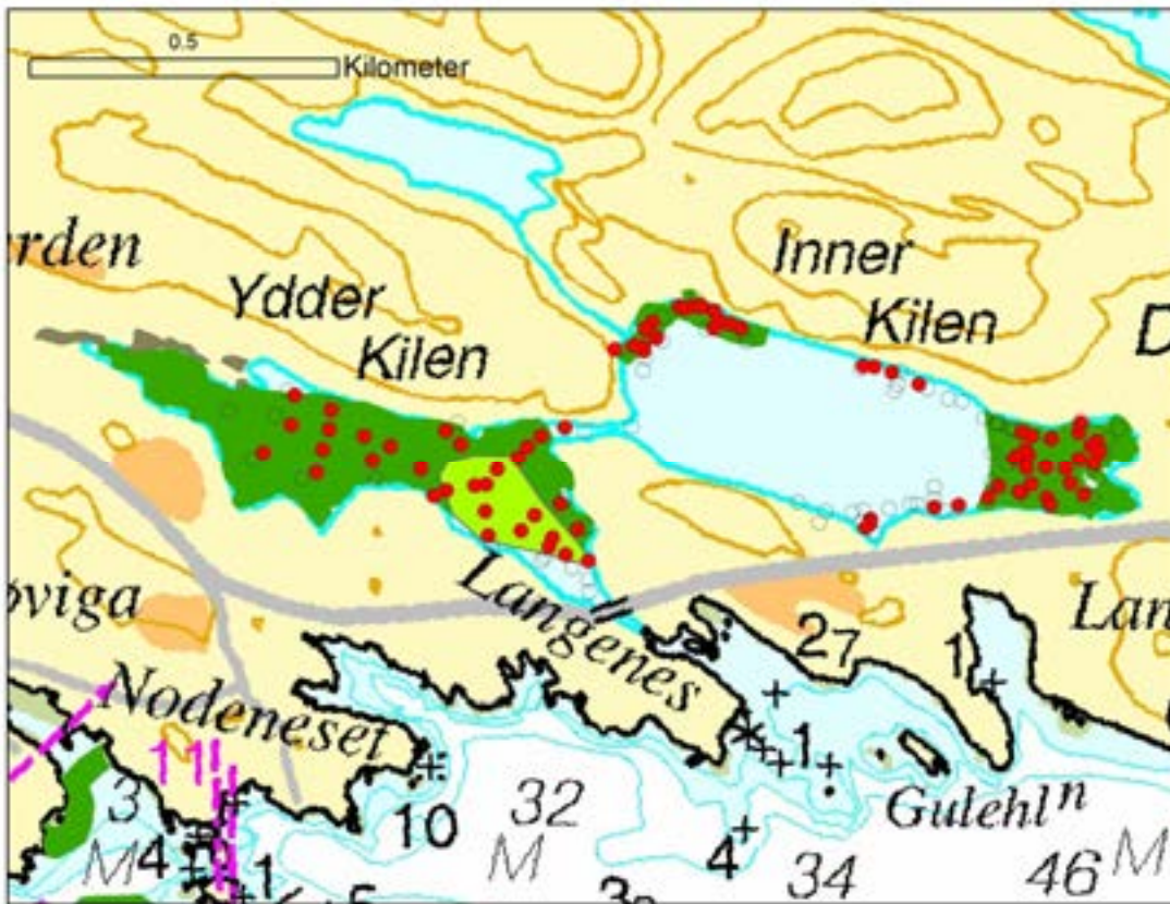
Figur 5. Registrerte forekomster av ålegras i Indre og Ytre Kilen. Røde prikker viser forekomst av ålegras, åpne sirkler viser fravær. Tidligere registrerte forekomster er vist med mørk grønn farge.