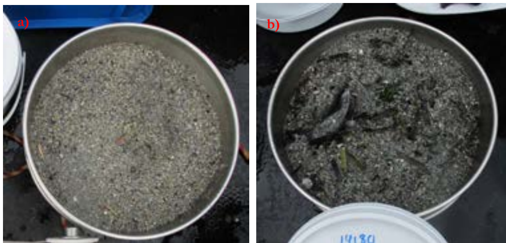
Figur 4. Bilde av bunnsediment fra stasjon a) B1 og b) B2

Det er i dag svært grunt der utløpet av den nye kanalen er planlagt (Stasjon B2). Sedimentprøvene ble tatt på 1,5 m dyp. Sedimentet var sandig med mørkere, brun farge ( Figur 3b ). Replikat B2-II og B2-III luktet av hydrogensulfid (H 2 S) og hadde mye organisk innhold og lite infauna. Replikat B2-I luktet kun svakt av hydrogensulfid og hadde en noe høyere forekomst av dyr, manglebørstemarken Capitella capitata var svært tallrik. Bunnsedimentet på stasjonen virket å være tilført plantemateriale fra tilstøtende ålegrasenger og trådformede algetepper og hydrogensulfid i bunnsedimentet forklarer antagelig lite infauna i to av de replikate prøvene.