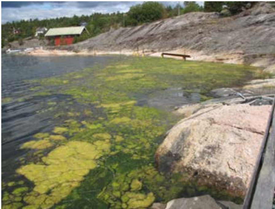
Figur 7. Matter av grønnalgen Cladophora cf. vagabunda på stasjon F5

Stasjon F1 var noe sedimentert, antagelig som resultat av bølger som drar med seg sand inn mot land.