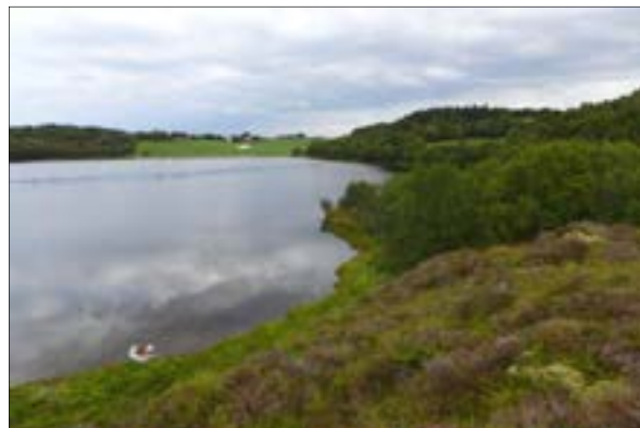
Figur 2. Sjøvågen, sett mot nordøst (venstre) og Gaustadvågen, sett mot nordøst (høyre).