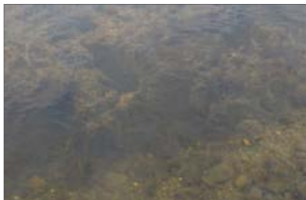
Figur 3. Brun algebegroing på vannvegetasjon i strandsona.

I tillegg ble arten registrert på grunt vann ved nordre strand. Det var mye brun algebegroing (ikke identifisert) på plantene i Sjøvågen, både på kransalgene og på langskuddsartene (figur 3).