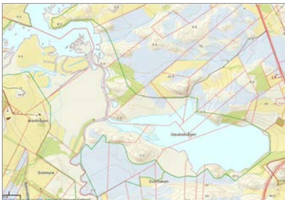
Figur 1. Sjøvågen på Smøla (øverst) og Gaustadvågen i Eide (nederst).