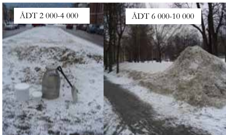
Figur 1. Snø fra Drammen sentrum 20.2.2012.