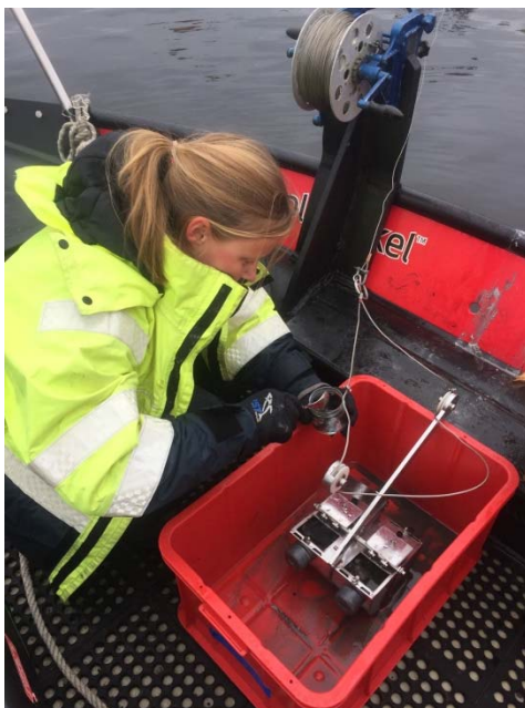
Figur 3. Prøvetaking av sediment med liten Van-Veen grabb.