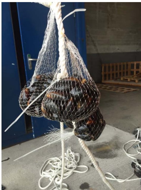
Figur 2. Blåskjell fordelt mellom tre nett ble hengt i tau fra Hovedkai og Dypvannskai på hhv. 4, 6 og 10 meters dyp. En tykk kjetting var festet i enden av tauet som lodd mot bunn.